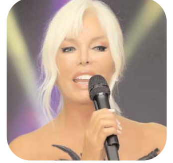
"Ajda" adlanan yeni albom üçün çəkilmiş fotoların müəllifi Səfa Gürsoydu. Qeyd edək ki türk pop musiqisinin əfsanəsi olan Ajda Pekkan 1946-cı il 12 fevralda İstanbulda dünyaya gəlib. Atası Ridvan Hayri orduada doniz qüvvələrində mayor, anası Gültən Nevin Dobrucaada ev xanımı olub. Çamlıcaqda Qızlar litseyində təhsil alan Ajda musiqi uğruna təhsilini yarımaq qoyub. Həyatı çətinliklərlə keçən Ajdanın ilk kədəri, ilk üzüntüsü valideynlərinin boşanması olub. O, kədərli anlarını heç vaxt unutmur. "Valideynlərim ayrılanda çox üzüldüm. Sanki bir boşluqda yaşayırdım və bu boşluq musiqi ilə doldurmağa başladım. Ata-ana-

Qocalmaq bilməyən ulduzun iddialı şəkli illəri ölkə musiqisevərləri arasında gündəmə çevrilib.