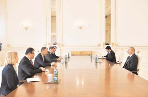
Azərbaycan Respublikasının Prezidenti İlham Əliyev Avropa İttifaqının xüsusi nümayəndəsi Toivo Klari qəbul edib.

Görüşdə Azərbaycan-Avropa İttifaqı əməkdaşlığının inkişaf perspektivləri müzakirə edildi. Avropa İttifaqının Azərbaycanla əməkdaşlığın inkişafına önəm verdiyi vurğulandı, Azərbaycanın Avropa İttifaqının etibarlı tərəfdaşı olduğu bildirildi.